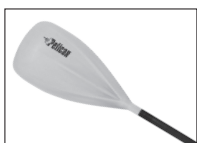
VAYU PADDLE PAGAIE VAYU