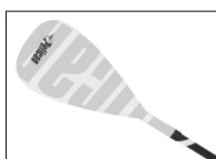
VATE PADDLE PAGAIE VATE

PS1145-00 (Yellow green/Citrine) PS1146-00 (Lime/Lime) PS1147-00 (Red/Rouge)