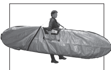
SUP BOARD BAG SAC DE TRANSPORT POUR SUP