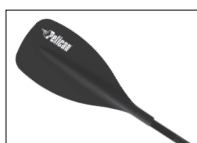
MAELSTRÖM PADDLE PAGAIE MAELSTRÖM