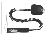
SUP LEASH LAISSE SUP