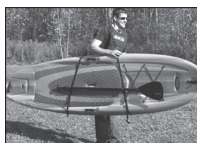
CARRIER STRAP COURROIE DE TRANSPORT