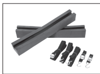
CAR TOP CARRIER ENSEMBLE DE TRANSPORT POUR VÉHICULE