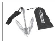
FOLDING ANCHOR ANCRE RÉTRACTABLE