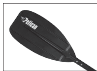
JUNIOR PADDLE PAGAIE JUNIOR